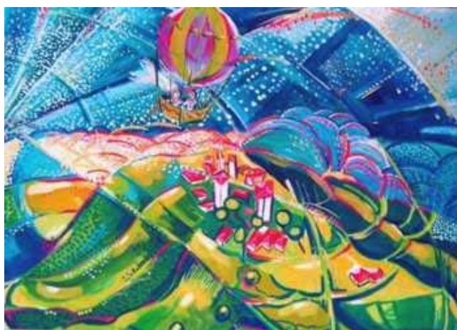
Sposi+cielo+mongolfiera Tempera su cartoncino telato 2002

Dichiarazione Universale dei Diritti dell'Uomo : ciascuno ha diritto di sposarsi e di fondare la propria famiglia senza restrizioni di razza, nazionalità o religione.