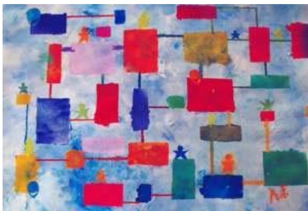
Internet Tempera su carta, maschere pretagliate 2002

L'autore, che è affetto da una grave tetraparesi spastica , utilizza da alcuni anni gli strumenti informatici, sia per studiare (frequenta un istituto professionale per il turismo), in vista di un futuro inserimento lavorativo, sia per comunicare con gli altri. Per questo ha scelto la raffigurazione astratta di internet , nuovo ed efficace strumento di lavoro, per affermare che il lavoro è un diritto fondamentale di ciascun uomo.