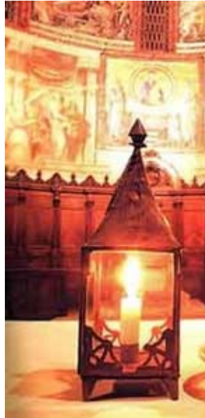
[Lantern, Santa Maria in Trastevere, Roma]