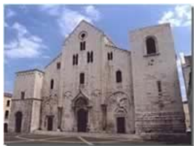
Un'immagine della basilica

La Basilica di San Nicola rivela la sua storia già nell'architettura esterna, che sembra ispirata più alla struttura di un castello che di una chiesa. Nel periodo normanno fu infatti usata più volte come fortezza difensiva. I quattro cortili che la circondano anticamente erano chiusi, riservati solo al clero della basilica, che li metteva a disposizione dei commercianti nel periodo delle fiere dedicate al santo nei mesi di maggio e