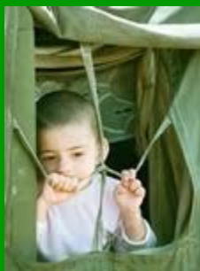
Le guerre dimenticate: la Cecenia