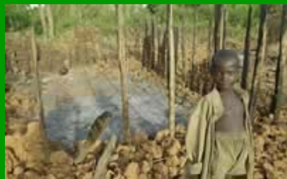
Le guerre dimenticate: la Repubblica Democratica del Congo