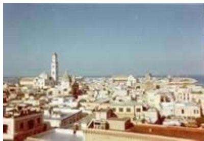
Panorama di Bari

Una leggenda narra che fu lo stesso Santo, di passaggio nella città, a scegliere proprio Bari come luogo in cui sarebbero dovute riposare le sue ossa.