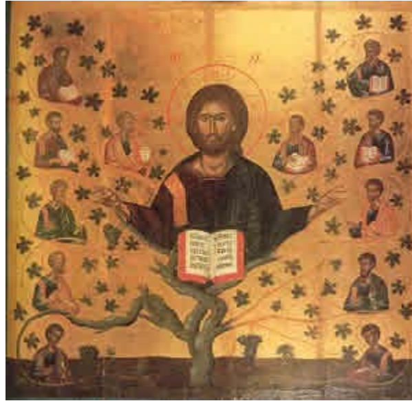
[Il Cristo vite vera, Monastero della Vergine Odigitria, Creta]