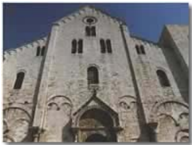
La facciata della basilica

Le reliquie di San Nicola furono portate a Bari il 9 maggio 1087 da alcuni marinai baresi. La Basilica fu eretta nel luogo sede della cittadella amministrativa e militare bizantina. I lavori di costruzione proseguirono a rilento a causa dell'instabilità politica della regione. La basilica fu consacrata il 22 giugno 1197. Da allora Bari