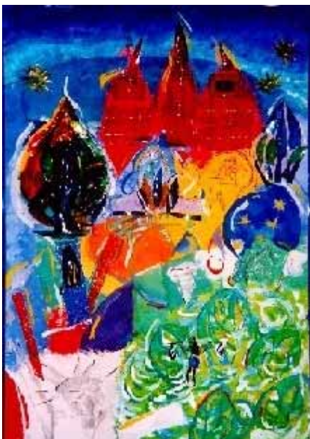
Visualizza l'immagine ingrandita Una città per tutti

Tempera su cartoncino e collages di plastica dipinta con colori per vetro 2004