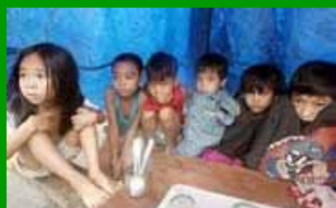
I bambini nel mondo: le Filippine