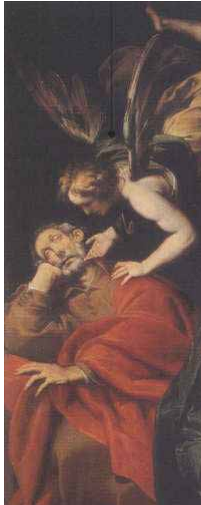
[Giangiacomo Barbelli, Sogno di Giuseppe (particolare), 1600, Collezione privata]