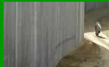
Costruiamo ponti e non muri