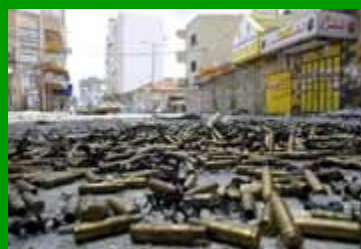
Strade di guerra