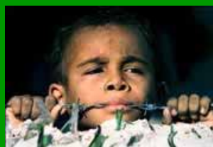
Bambini in guerra