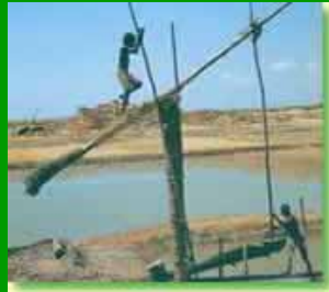
Acqua: un bene prezioso