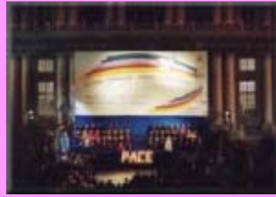
Genova - Piazza Matteotti Cerimonia conclusiva dell'incontro ecumenico "Chiese sorelle, popoli fratelli"

All'interno della Cattedrale nel settembre 2001 è stata posta, per volere del cardinale Dionigi Tettamanzi, una targa commemorativa dell'incontro Ecumenico " Chiese sorelle, Popoli fratelli " promosso dalla Comunità di Sant'Egidio nel novembre 1999.