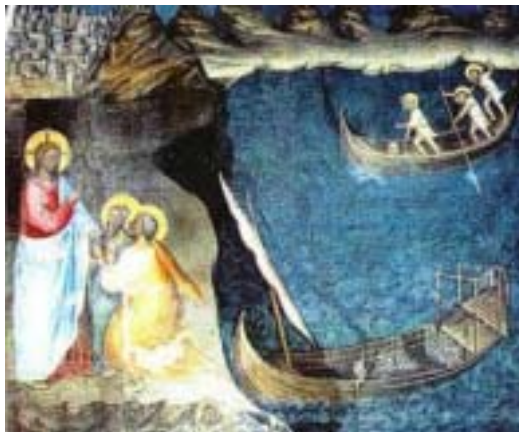
[Giusto de' Menabuoi, Ciclo del Battistero, Padova.]

Tempo ordinario Domenica 27 gennaio 2002