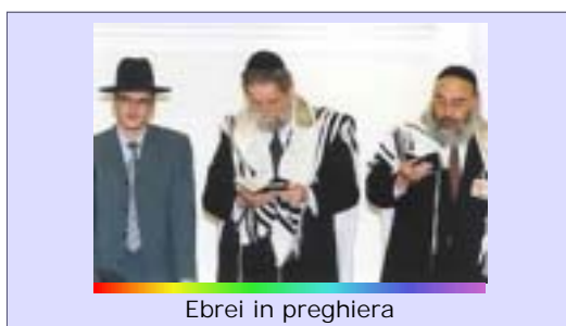
Ebrei in preghiera

Noi del Movimento de "Gli Amici" vogliamo sostenere quest'impegno.