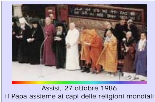
Assisi, 27 ottobre 1986 Il Papa assieme ai capi delle religioni mondiali

Siamo convinti in particolare che gli Ebrei, i Cristiani e i Musulmani, che riconoscono come padre della loro fede il patriarca Abramo, vivendo l'amicizia e il dialogo fra loro, possono impegnarsi insieme per vincere la povertà nel mondo e costruire un mondo di pace per tutti. Tutte le religioni possono lavorare per la pace: PACE E' UNO DEI NOMI DI DIO !