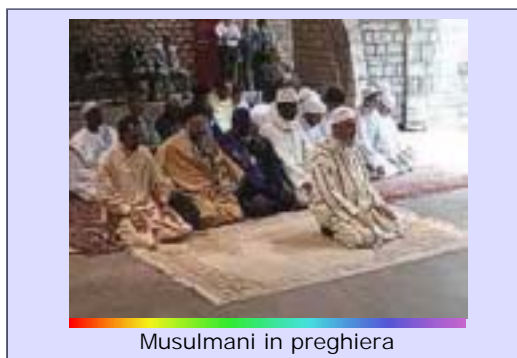
Musulmani in preghiera

Ci siamo resi conto, soprattutto a partire dai tragici avvenimenti dell'11 settembre negli Stati Uniti, che molte persone conoscono poco le religioni. C'è molta ignoranza e si fa tanta confusione. Anche noi tante cose non le sappiamo. Per questo è importante parlare insieme , ascoltarsi e rispettarsi: tutti possono vivere l'amicizia, anche persone di religione diversa!