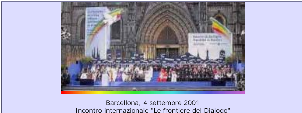
Barcellona, 4 settembre 2001 Incontro internazionale "Le frontiere del Dialogo"

In questo mese dedicato alla preghiera per l'Unità dei cristiani e in vista dell'incontro di Assisi del 24 gennaio, "Gli Amici" invitano soprattutto a pregare per il dialogo e per la pace nel mondo.