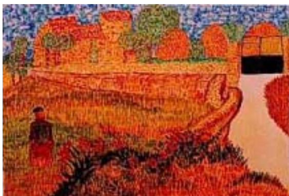
"Il prato davanti alle case". Tempera su carta. 1993