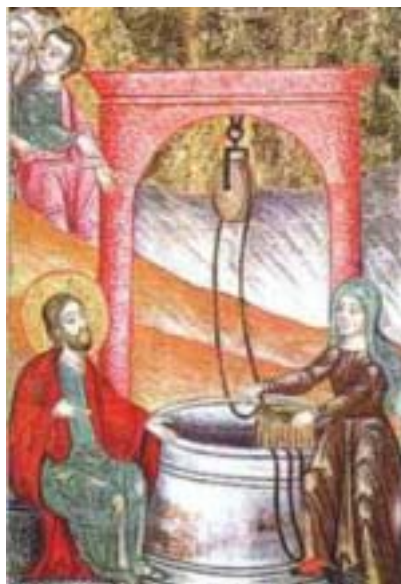
[Miniatura araba del sec. XVII, Parma, Biblioteca Palatina]

Tempo di Quaresima Domenica 3 marzo 2002