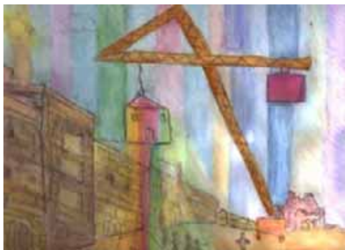
La costruzione della città degli Amici Matita, china ed acquerello 2001

L'opera che presentiamo si ispira alla costruzione della “Città degli Amici” di cui parla il manifesto del movimento. L'artista ha trovato un modo originale per rappresentarla: una gru sta deponendo una casa colorata in mezzo alla città e da questo edificio si irradia un arcobaleno che illumina con i suoi colori tutta la scena. Dopo aver eseguito il disegno a matita, l'autore ne ha sottolineato i tratti con l'inchiostro di china ed ha in seguito dato