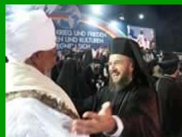
Tra guerra e pace, Religioni e culture si incontrano