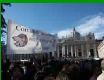
Marcia per la pace