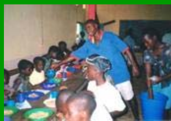
Il pranzo di Natale in Africa