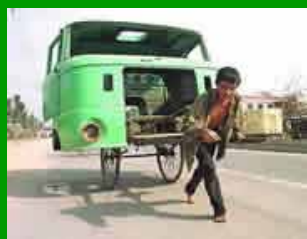
I popoli della Terra (Vietnam)