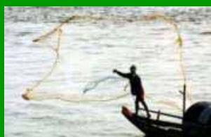
I popoli della Terra (Cambogia)