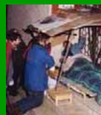
Il presepe di Sant'Egidio